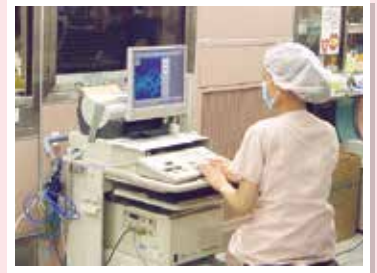
「手術中のモニタリング検査」安全な手術をサポートします