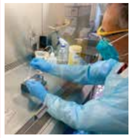
「新型コロナウイルスPCR検査」ガラスで隔てたキャビネット内で慎重に操作します