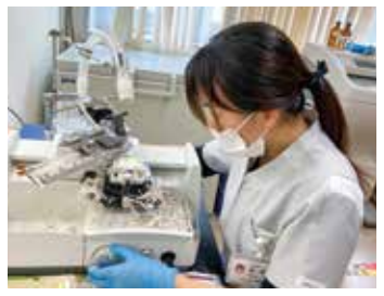
病理検体を薄くスライスする「薄切作業」

これからますます高度多様化する医療ニーズや、地域の皆様の健康維持に向けて、「データと誠意」で応えられる検査室を目指して邁進したいと思えます。