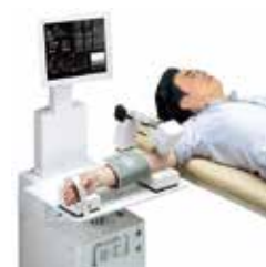
血管内皮機能検査(FMD)

血管機能検査は血管機能に特化した検査です。とくに血管内皮機能検査 (FMD) は長野県内でもまだ導入台数が少ない検査装置を使用して検査します。動脈硬化になる一歩手前の血管内皮機能の状態を知ることによって、動脈硬化の早期進行のリスクを評価します。