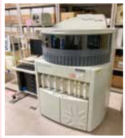
「自動免疫組織化学染色装置」免疫反応を利用して細胞や組織の特徴を染め出します