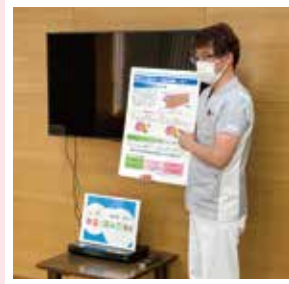
「知っ得!検査の読み方講座」わかりやすく説明します