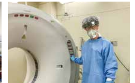
感染症対策も万全に！