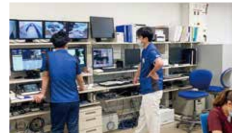
放射線治療は綿密に計算されています