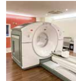
放射性医薬品を使ったPET(左)とSPECT(右)