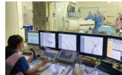
脳や心臓、腹部を行う「カテーテル治療」の様子