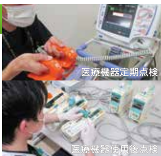
医療機器定期点検

院内の様々な機器を修理、点検し、常に安全で安心して使える状態にして各部署に提供しています。