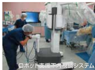
ロボット支援下内視鏡システム

電気メス、麻酔器など手術に使う機器の点検や、出血した血液を洗浄し再利用する自己血回収装置の操作、ロボット支援下内視鏡システム(ダ・ヴィンチ)の管理などに関わっています。