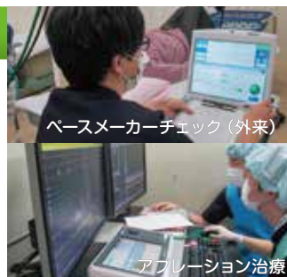
ペースメーカーチェック (外来)

心臓で不整脈の原因となってしまった部分を焼くアブレーション治療や、心臓を正しく動かすためのペースメーカーの設定や点検にも関わっています。